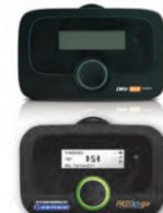
De OBU PAS Sango van Axxès en de DKV Box Europe zijn het laatste apparaat, maar de leveranciers onderscheiden zich van elkaar op het gebied van service.