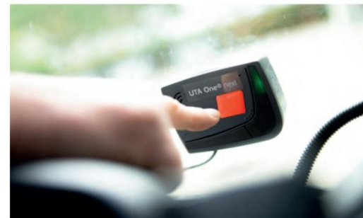
De gloednieuwe UTA One next.